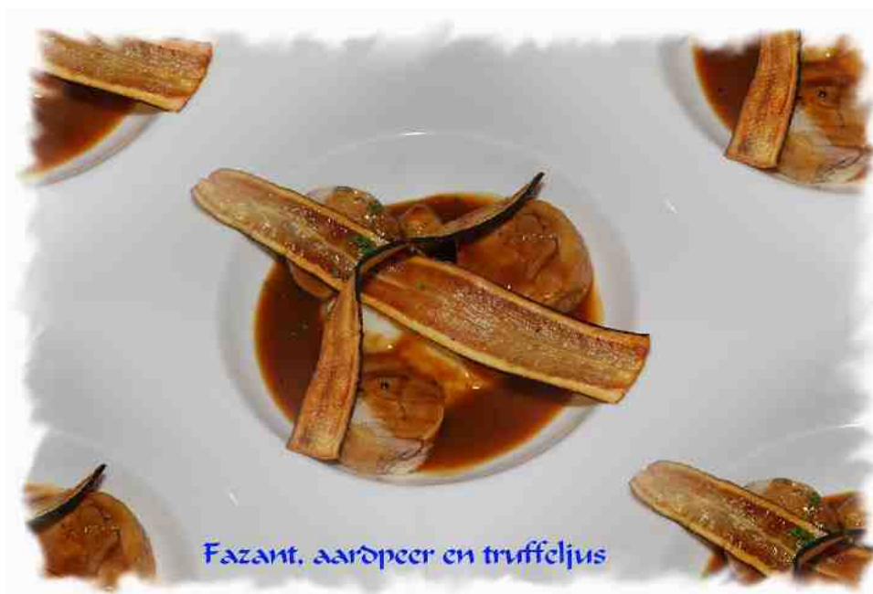
Fazant, aardpeer en truffeljus