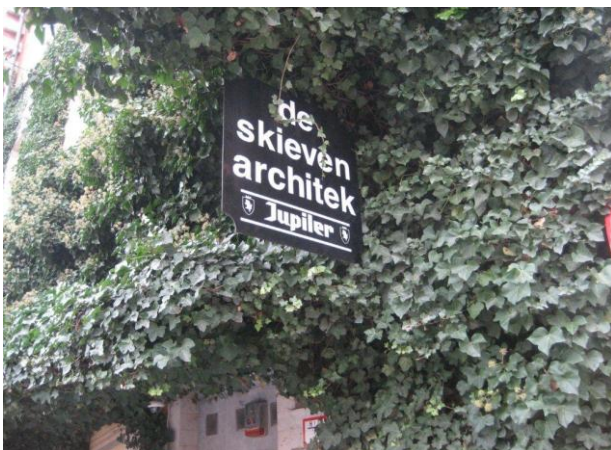
Op zijn Brussels