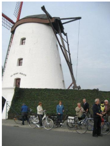
fietsers langs de Leirekensroute