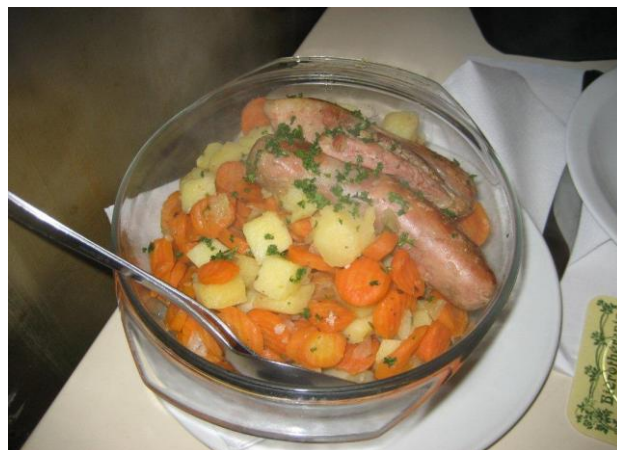
typisch eten "stoemp"